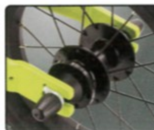
預留碟刹設計 增加改裝便利性