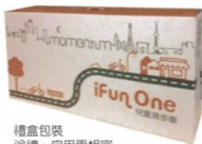
禮盒包裝 送禮、自用兩相宜