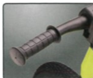
內窄外寬把手套 專為小孩騎乘安全 設計