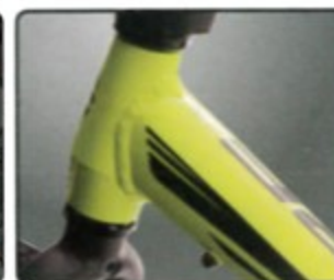
輕量化鋁合金車體 騎乘負擔最小