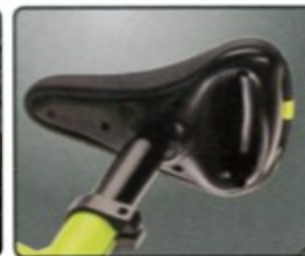
附提把式坐墊 隨身攜帶更方便