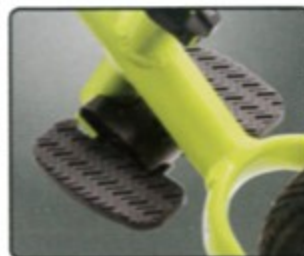
雙腳休息踏板 騎的更遠、更久