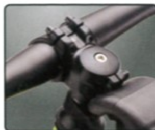
與登山車同規格 增加改裝便利性