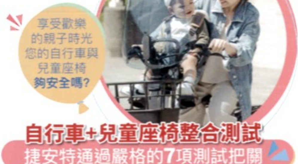
享受歡樂的親子時光 您的自行車與兒童座椅夠安全嗎? 自行車+兒童座椅整合測試 捷安特通過嚴格的7項測試把關