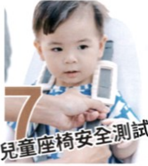
7 兒童座椅安全測試