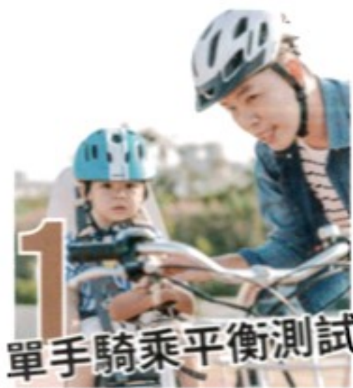
1 單手騎乘平衡測試