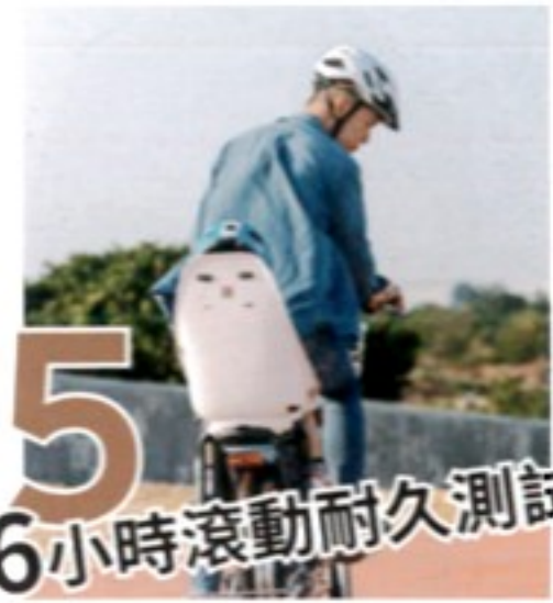
5 6小時滾動耐久測試