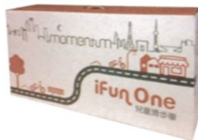
禮盒包裝 送禮、自用兩相宜