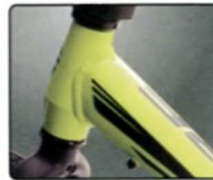
輕量化鋁合金車體 騎乘負擔最小