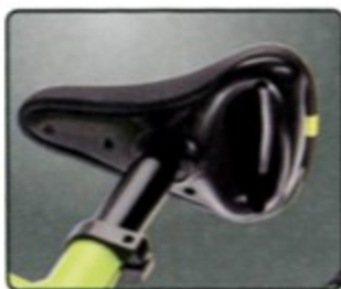
附提把式坐墊 隨身攜帶更方便