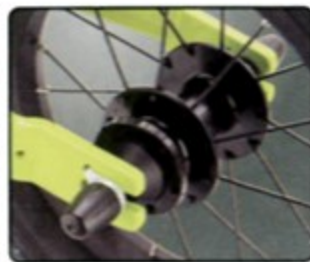
預留碟刹設計 增加改裝便利性