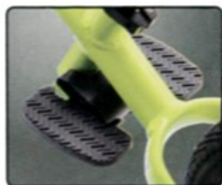
雙腳休息踏板 騎的更遠、更久