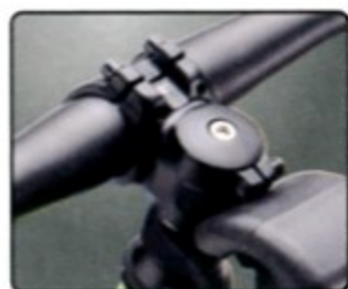
與登山車同規格 增加改裝便利性