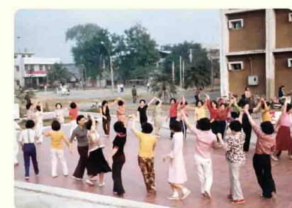
昔日後備軍人聯誼中心旁空地，大家一起跳土風舞

午後走在斗六老城區，亂入阿公阿媽們的聚會聽著他們聊時事、說故事，遠處老建築、散步、慢跑、打球、跳舞...，這宛如城市的後花園，慢慢地走、細細的品味斗六人的日常。