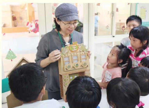
行動小學堂 小小建築師 108.8.8

從清朝到日治時期，太平大街就扮演著中南部重要的交通要道，也是當時重要的商店街。融合西洋巴洛克風格與臺灣本土元素、現代主義建築風格的過度到現代主義建築全面風行的簡單幾何風格，太平老街數百公尺的建築群呈現日治三個時期不同風格的建築特色。漫遊老街還可看到許多百年老店、西服訂製店、金飾店、鐘錶眼鏡...，不同時期有著不同樣貌的產業景緻，也承載著在這塊土地生活人們的點滴。